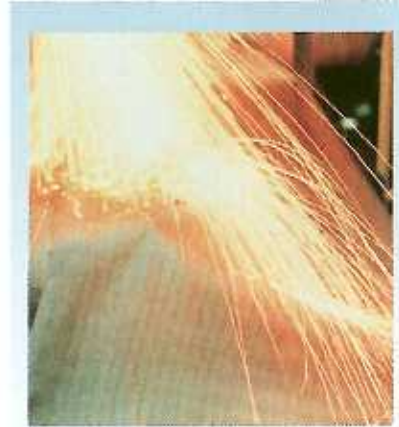
スパッターシート(耐火シート)◆