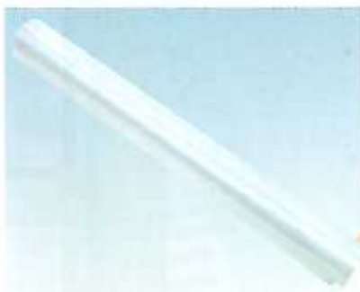
土間用養生ポリシート◆ 全開・ポリフィルム

コンクリート養生用マット 1号-3t、1.2m×50m、不織布 (1140-3101-00) 2号-10t、1.0m×30m、ウレタン (1140-3102-00)