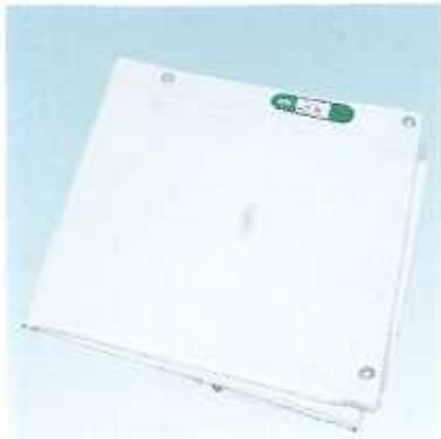
防災シートⅡ類◆ ※ナイロンターポリン製