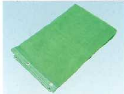
防災メッシュⅡ類(グリーン、ブルー)◆