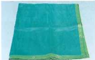
飛散防止ネット 緑/白◆