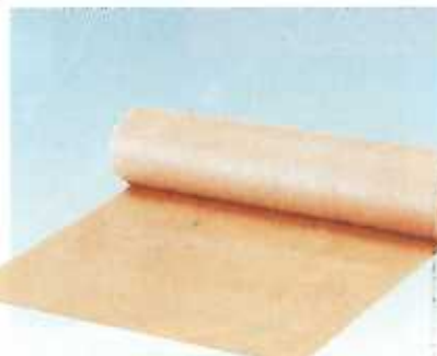
ダンボールシート◆